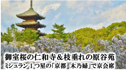
御室桜の仁和寺&枝垂れの原谷苑 ミシュラン1つ星の「京都 木乃婦」で京会席