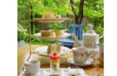
バラクラのアフタヌーンティーランチ