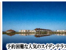
予約困難な人気のスイデンテラス