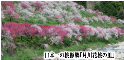
日本一の桃源郷「月川花桃の里」