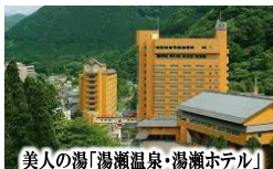
美人の湯「湯瀬温泉・湯瀬ホテル」