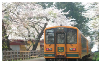
「津軽鉄道」で桜のトンネル芦野へ