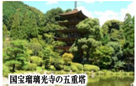
国宝瑠璃光寺の五重塔