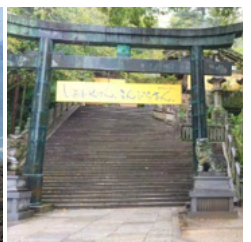
金刀比羅宮こんぴら参り