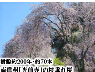
樹齢約200年・約70本 南信州「光前寺」の枝垂れ桜