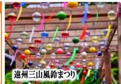
遠州三山風鈴まつり