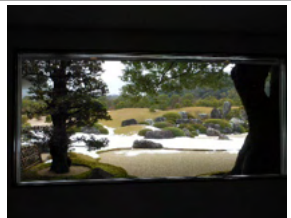
庭園も美しい足立美術館