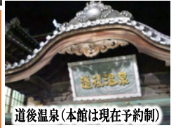
道後温泉(本館は現在予約制)