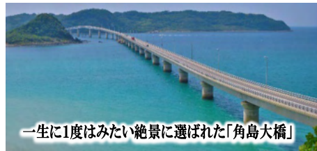
一生に1度はみたい絶景に選ばれた「角島大橋」