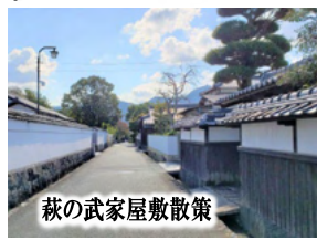
萩の武家屋敷散策