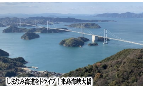
しまなみ海道をドライブ!来島海峡大橋