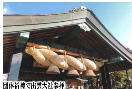
団体祈禱で出雲大社参拝