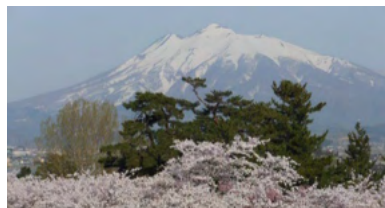
ゆとりの2時間のんびりお花見 残雪の岩木山眺望!弘前城の桜