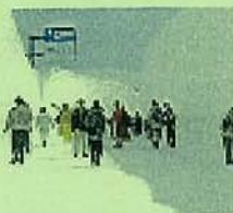
八甲田雪の回廊ウォーク (イメージ)