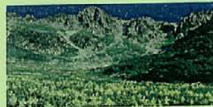
夏の千畳敷カール

山を語るに外せない長野県。スニーカー1つで楽しめる上高地からロープウェーを利用して本格登山の百名山「駒ヶ岳」まであなたに合わせて長野の山々が受け入れてくれますよ。