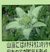
山頂にはハチ初スギヤや 固有の花が群落を形成

1/各地~那珂IC(6:30)= 東稲山登山(約5.5km、約2.5 時間)=花巻文化財センター=宿 坊・大和坊(泊) (開閉) 2/宿坊=河原坊~山頂(1917m) ~小田越(約5km、約7時間)= 下山後入浴=那珂IC(21:30頃) ~各地 (開閉)