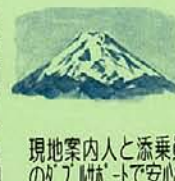
現地案内人と添乗員 のガイドで安心

1/各地~水戸IC(5:00)= 五合目長めの滞在/昼食と 準備~本七合目(泊)鳥居荘 約3km、約4時間 (開閉) 2/宿(深夜発)~山頂(3776m) ~下山~五合目=河口湖/入浴= 水戸IC(17:00頃)~各地 約5.2km、約3.5時間(開閉)