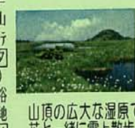
山頂の広大な湿原で 花と一緒に雲上散歩

1/各地~水戸IC(6:00)= みつまた・和田小屋~苗場山 (2145m)(泊)苗場山頂トレキ ング約9km、約5時間 (開閉) 2/苗場山~坪場~(小赤沢)入浴 ~三合目=小赤沢温泉/昼食・入浴 =水戸IC(17:30頃)~各地 約7km、約4時間 (開閉)