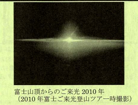
富士山頂からのご来光 2010年 (2010年富士ご来光登山ツアー一時撮影)

世界遺産の古道を歩く P079 世界遺産を歩く! 語り部ガイドがご案内 弘法大師が開いた表参道「高野山・町石道」ハイキング 【登山初級】 最少催行20名/募集40名 食事: 朝2・昼2・夕2 宿: 宿坊個室受付 出発日 5/28(土) 料金 38,000円 道標の石柱をたどり世界遺産を一步步自分の足で歩く旅 1/各地~水戸IC(21:00)=車中泊 2/=慈尊院...雨引山分岐...六本杉峠...古峠...二ツ鳥居...神田応其池...笠木峠...矢立...大門...根本大塔...金堂...金剛峯寺...高野山/天徳院(泊)予定 歩程: 約6.5時間・約21.5km 3/宿=一ノ橋~高野山奥/院参拝(約1時間)=柿の葉寿司の昼食=(夕食弁当)=水戸IC(22:00頃)~各地