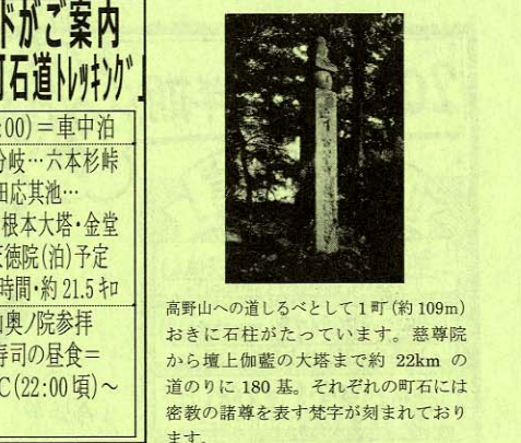
高野山への道しるべとして1町(約109m)おきに石柱がたっています。慈尊院から壇上伽藍の大塔まで約22kmの道のりに180基。それぞれの町石には密教の諸尊を表す梵字が刻まれております。

世界遺産の古道を歩く P079 世界遺産を歩く! 語り部ガイドがご案内 弘法大師が開いた表参道「高野山・町石道」ハイキング 【登山初級】 最少催行20名/募集40名 食事: 朝2・昼2・夕2 宿: 宿坊個室受付 出発日 5/28(土) 料金 38,000円 道標の石柱をたどり世界遺産を一步步自分の足で歩く旅 1/各地~水戸IC(21:00)=車中泊 2/=慈尊院...雨引山分岐...六本杉峠...古峠...二ツ鳥居...神田応其池...笠木峠...矢立...大門...根本大塔...金堂...金剛峯寺...高野山/天徳院(泊)予定 歩程: 約6.5時間・約21.5km 3/宿=一ノ橋~高野山奥/院参拝(約1時間)=柿の葉寿司の昼食=(夕食弁当)=水戸IC(22:00頃)~各地